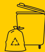
GELBE TONNE & GELBER SACK

Mit dem Sammeln von Verpackungen leistest du einen Beitrag zum Umwelt- und Klimaschutz.