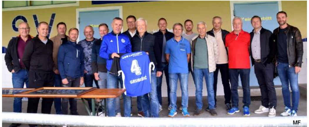
Meisterspieler und Funktionäre von damals

Der Tag führte die ehemalige Meisterschaft nach einem kurzen Aufenthalt am Sportplatz ins Gasthaus Windhager, auch bekannt als „Windi“. Wie damals nahmen die Spieler und Funktionäre in der „Franzl-Stubn“ Platz und ließen